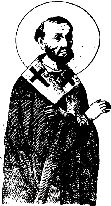
Ἰωάννης ὁ Χρυσόστομος

Εἰκόνες. Ἡ Ἐκκλησίαις στολιζόνται καὶ μὲ εἰκόνες τοῦ Χριστοῦ, τῆς Παναγίας καὶ τῶν ἁγίων. Αὐτὲς μᾶς θυμίζουσιν τὰ ἱερὰ πρόσωπα τῆς θρησκείας γι' αὐτὸ πρέπει νὰ τίς τιμοῦμε. Ἡ ἀρχαιότερη εἰκόνα εἶναι τοῦ Χριστοῦ σὲ μορφὴ τοῦ καλοῦ ποι-